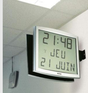
Cristalys Date auf einem doppelseitigen Träger