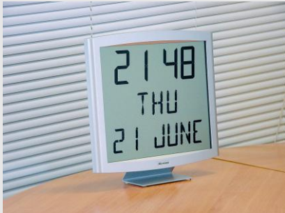
Cristalys Date auf einem Tischträger